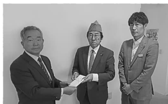
上士幌ライオンズクラブ様