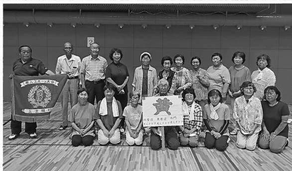
優勝の黄色チーム

8月18日(金)、上士幌町スポーツセンターにて「ふれあい運動交流会」を開催しました。 これまでの、「おとしより・障がい者スポーツ大会」から「ふれあい運動交流会」へ名称を新たに、コロナ禍で中止していましたが、4年ぶりに開催いたしました。