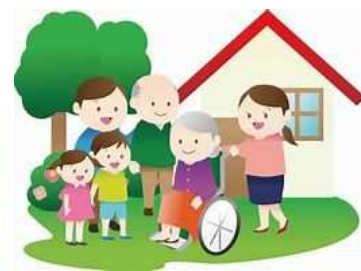
上士幌町の高齢者支援と 地域福祉・介護関連事業のイメージ図

『制度や分野ごとの縦割りから「支え手」「受け手」の関係を超越して地域や住民や相談機関が「我が事」として関り、人と人、人と資源が世代や分野を超越して「丸ごと」つながることで、住民一人ひとりの暮らしと生きがい、地域とともに創っていく社会の実現を目指す。』(厚生労働省ホームページ) 社会です。